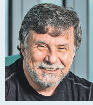
Türkiye Bilişim Vakfı Yönetim Kurulu Başkanı Faruk Eczacıbaşı

(Girvak) gençlerde girişimcilik kültürünü oluşturmak ve yaygınlaştırmak için çaba sağlarken Türkiye Bilişim Vakfı (TBV) ise özellikle bilgi ve iletişim teknolojilerinin kaldıraç ve etki gücünün artırılmasını hedefliyor ve bu gücü özellikle “iyilik için teknoloji” hedefine yönelik yapmak istiyor. Sonuç olarak iki vakfın farklı yaklaşımlarının aynı hedefe özellikle de gençlere yönelmesi önemli bir sinerji yaratacak”.